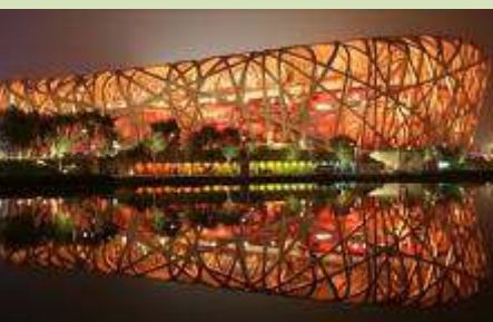
«Η Φωλιά», το εθνικό στάδιο του Πεκίνου