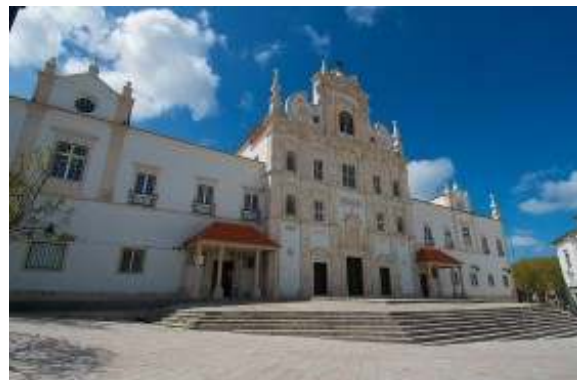
8. PORTUGAL, Santarém Cathedral and Diocesan Museum