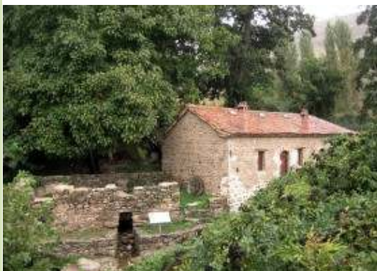
3. ΕΛΛΑΔΑ, Αγ.Γερμανός Πρέπες Παραδοσιακός Νερόμυλος