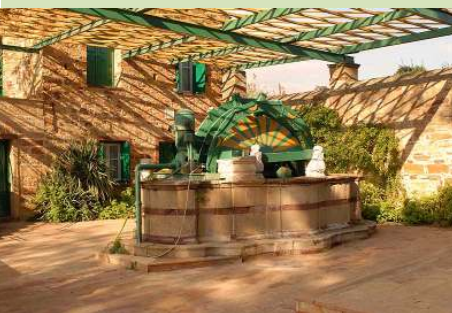
Κάμπος Χίου, Ελλάδα