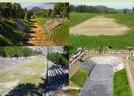
Αρχαία Ελληνικά Στάδια