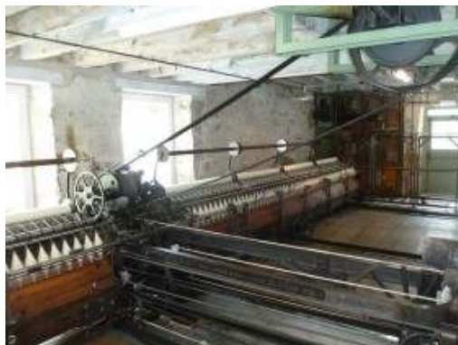
11. UNITED KINGDOM, Moray Knockando Woolmill στο Aberlour