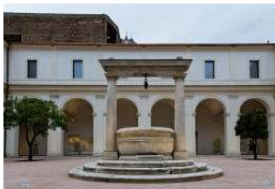
5. ITALY, Rome Λουτρά του Διοκλητιανού: πιόνα εξωτερικού χώρου