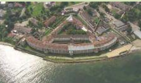
Οχύρωση Patarei Sea, Tallin Εσθονίας