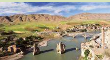
Οχύρωση Patarei Sea, Tallin Εσθονίας