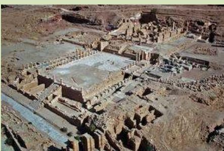
Wadi Mousa, Jordan Petra Archaeological Site