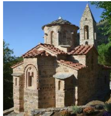
2. ΕΛΛΑΔΑ, Καστανιά Μάνης Βυζαντινή εκκλησιά Αγ.Πέτρου