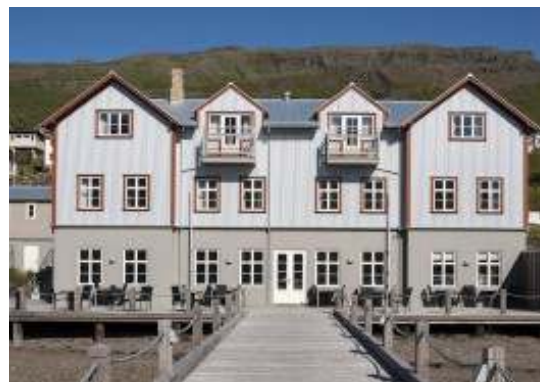
4. ICELAND, Faskrudsfjordur Γαλλικό Νοσοκομείο