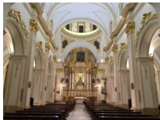
10. SPAIN, Murcia 6 εκκλησίες στην Lorca