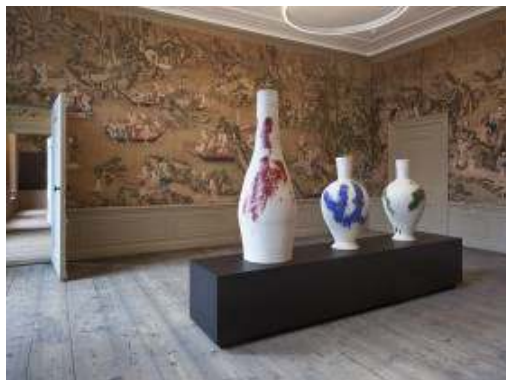
7. NETHERLANDS, Utrecht Μουσείο Oud Amelisweerd, Bunnik