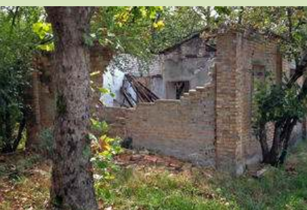
Italy World War II Concentration Camps