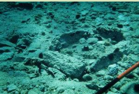
Elafonisos, Greece Pavlopetri