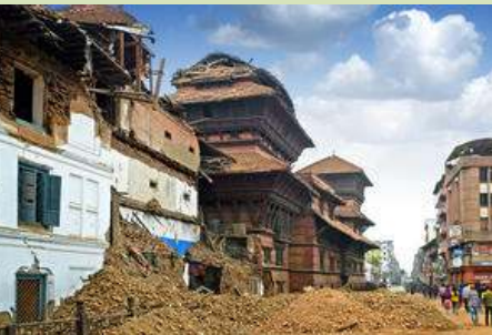
Nepal Cultural Heritage Sites of Nepal