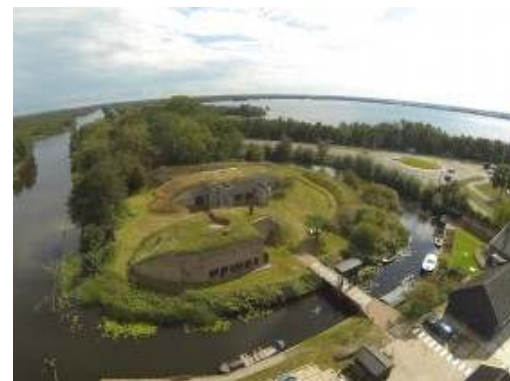
6. NETHERLANDS, Kortenhoef Φρούριο Kijkui