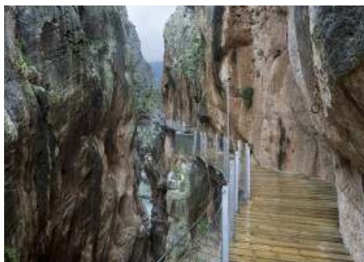
9. SPAIN, Malaga The King's Little Pathway, φαράγγι El Chorro