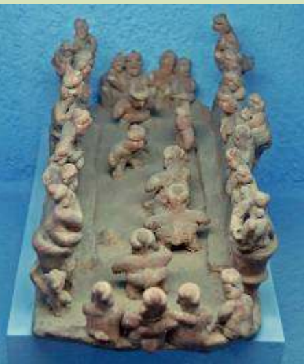
Πήλινο ομοίωμα που αναπαριστά άθλημα με μπάλα, προσφιές στους πολιτισμούς της προϊσπανικής Μέσης Αμερικής