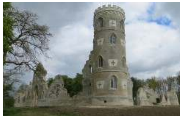
12. UNITED KINGDOM, Wimpole Wimpole Hall's Gothic Tower