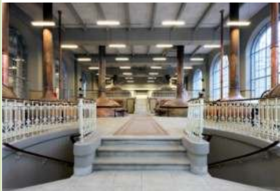
1. BELGIUM, Leuven Μετατροπή του ζυθοποιείου De Hooft σε κόμβο δημιουργίας